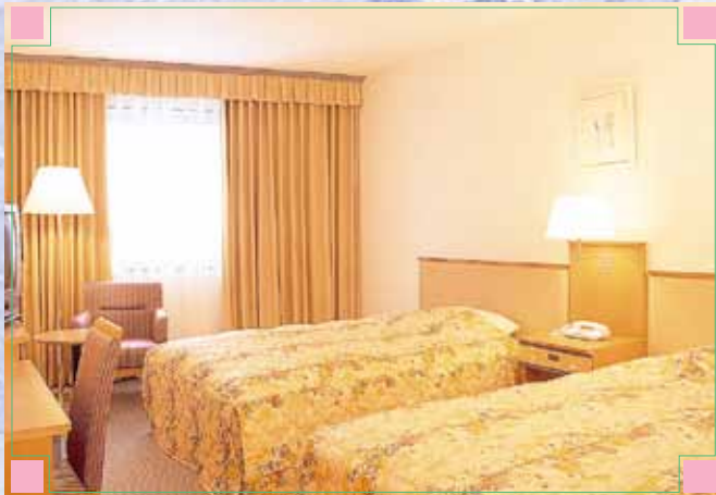
■スタンダードツイン STANDARD TWIN

■バスルーム BATH ROOM リラクゼーションタイムが お楽しみいただけるくつろぎの空間。