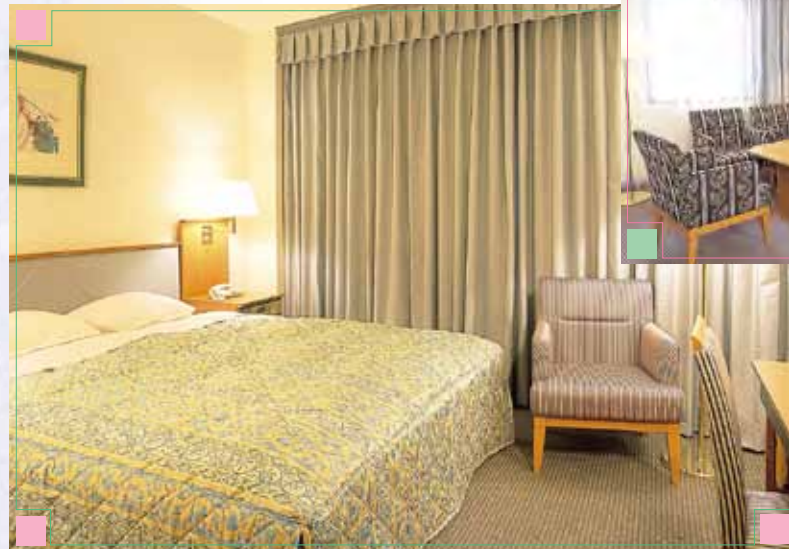
■スイートルーム SUITE ゆったりとした空間 ハイグレードなくつろぎ。