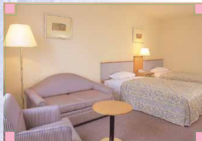
■デラックスツイン DELUXE TWIN

テラスレストランビサイド TERRACE RESTAURANT Be.SIDE 朝食 6:30~