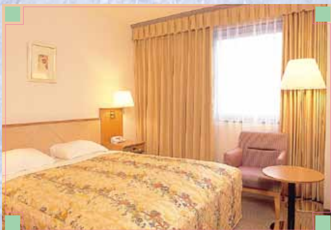
■スタンダードダブル STANDARD DOUBLE