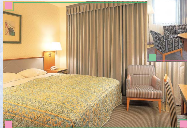
■スイートルーム ゆったりとした空間 ハイグレードなくつろぎ。