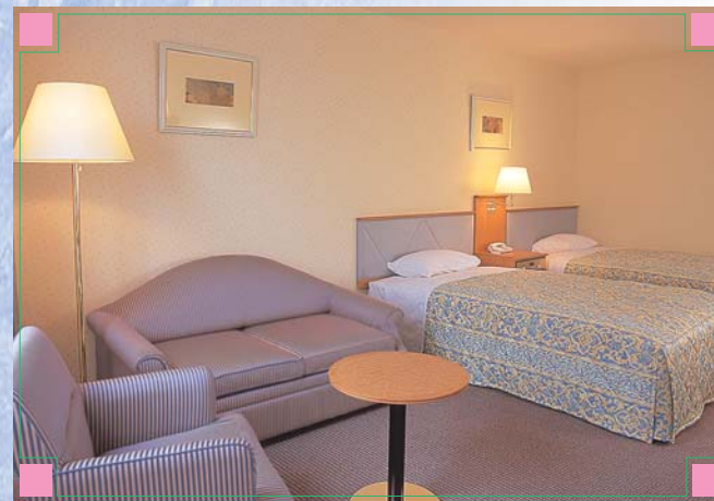
■デラックスツイン