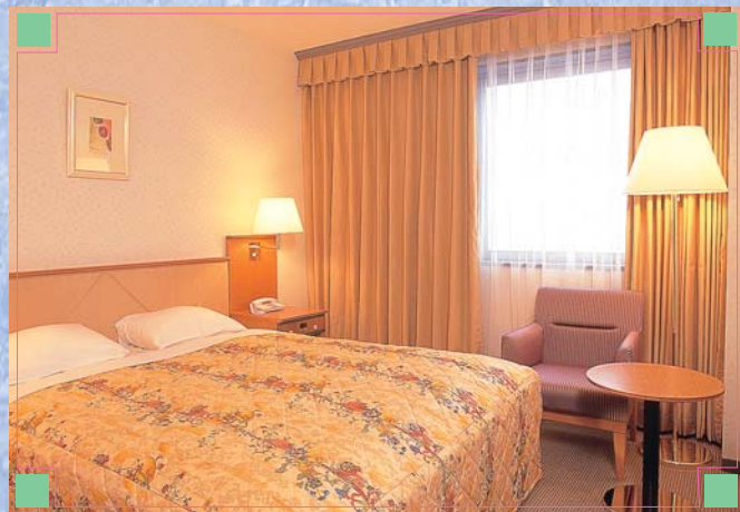
■スタンダードダブル