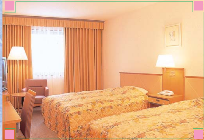
■スタンダードツイン