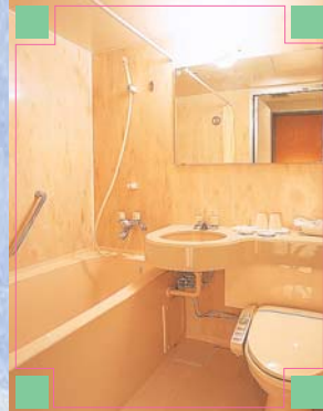
■バスルーム リラクゼーションタイムが お楽しみいただけるくつろぎの空間。